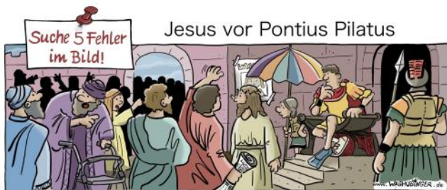
Pollator: Zeitung, Plakat, Sonnenschirm, Flosse