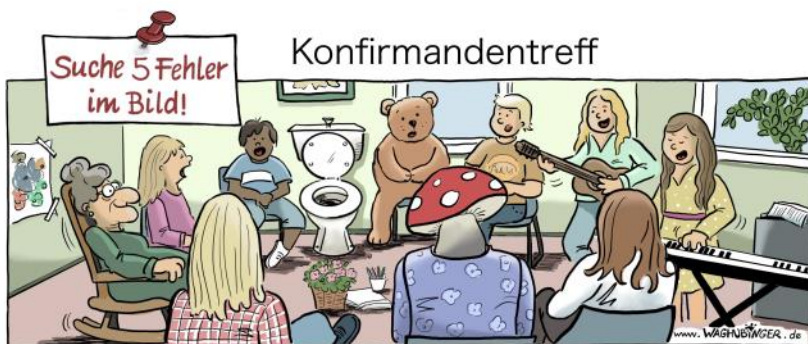
Oma, Toilette, Bär, Pliz, fehlende Klavier Tasten